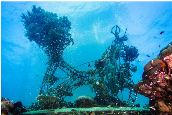
Unser Logo auf 12m nimmt Form an.