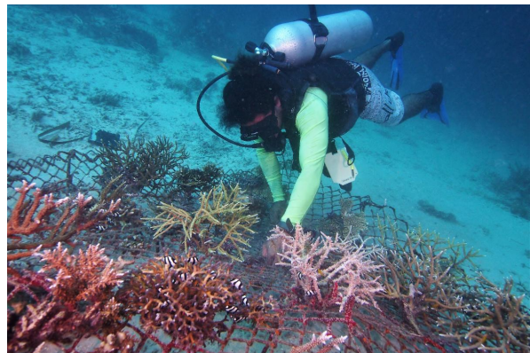
Die künstlich angelegten Riffe gedeihen.