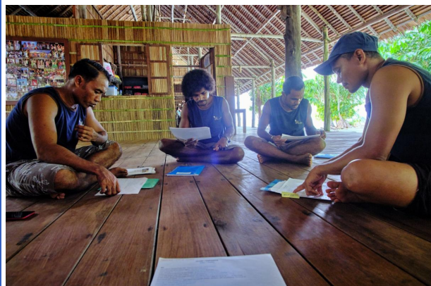
Englischkurs bis die Köpfe rauchen...