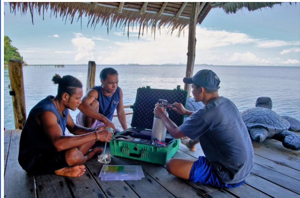
Sauerstoffkoffer, die sich für den Notfall auf den Booten befinden, werden geprüft.