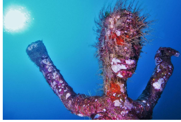
Die tanzenden Figuren auf 25m bekommen Farbe und auch Frisuren.