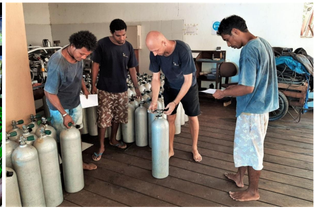
Tauchflaschen werden regelmässig gefüllt und das Innenleben und die Ventile ständig kontrolliert.