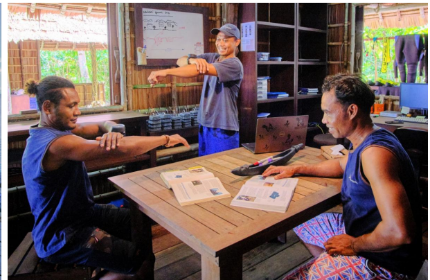
Navigation wird studiert und aufgefrischt.